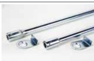
Paire de tubes de transmission (long. 1,5m), avec supports latéraux, pour installation avec un opérateur central