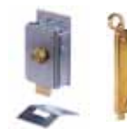
Accessoires divers page 153