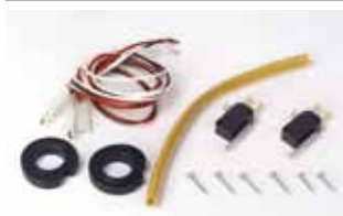
Kit d'installation de fin de course ouverture et fermeture Code article 390567