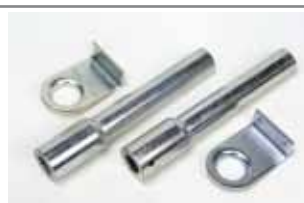
Paire de tubes de transmission, avec supports latéraux, pour installation avec deux opérateurs