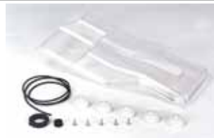
Kit pour degré de protection IP 44 Code article 110554