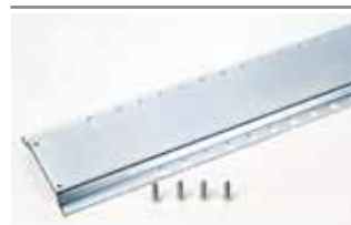
Longeron de fixation longueur 1,5 m