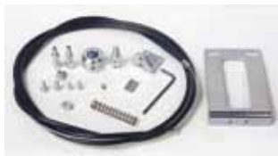
Déverrouillage extérieur pour adaptation sur poignée existante