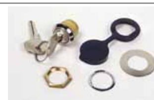
Déverrouillage extérieur à clés personnalisées du n. 1 au n. 50