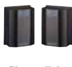
Photocellules et Colonnnettes page 148