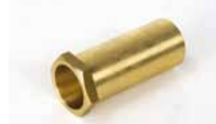
Rallonge de déverrouillage extérieur pour portes de plus de 15 mm d'épaisseur