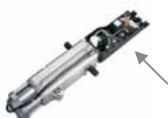
Carte électronique E550 incorporée Caract. techniques à la page 168