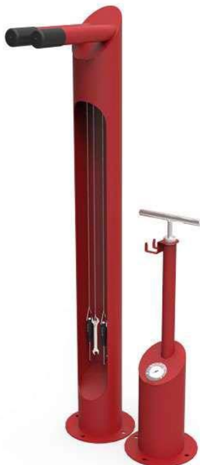
Figure 1. Totem outillage et pompe manuelle