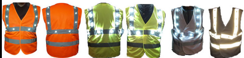
Orange fluo/led blanche