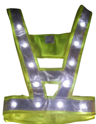
Chasuble Jaune fluo led blanche

Ils sont également utilisés dans le domaine des transports routiers (transporteurs, sociétés d'autoroutes...), des transports ferroviaires ou encore par les services de secours et de police