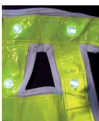
Chasuble Ferroviaire Tissu blanc, bande fluo jaune, led blanche