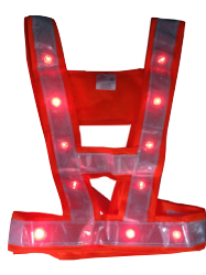
Chasuble Orange fluo led rouge