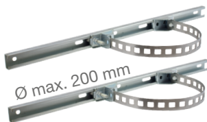
Ø max. 200 mm