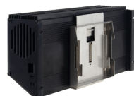
Kit de fixation rail DIN pour module 14M