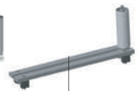
3649328 (nécessite 3649329)