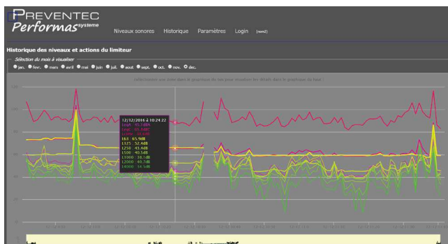
Visualisation de l'historique via serveur web embarqué