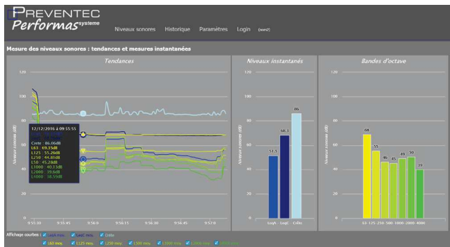
Visualisation des niveaux sonores via serveur web embarqué