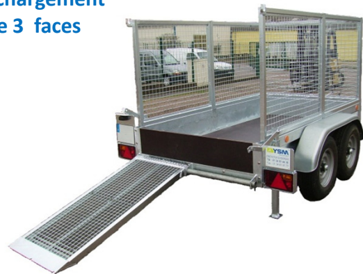
PB DCRG hayon 2 volets + rehausse 3 faces CU 1769 kg