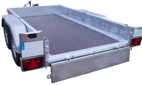
Plateau fixe et RBA - CU 1989 kg