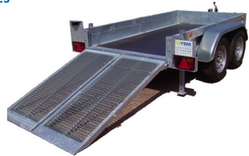
Hayon de chargement 2 volets : Occupe toute la largeur de la remorque sans interruption, se déploie en 2 moitiés pour une manipulation plus aisée.

Plateau fixe DCS et rampes alu - CU 1957 kg -