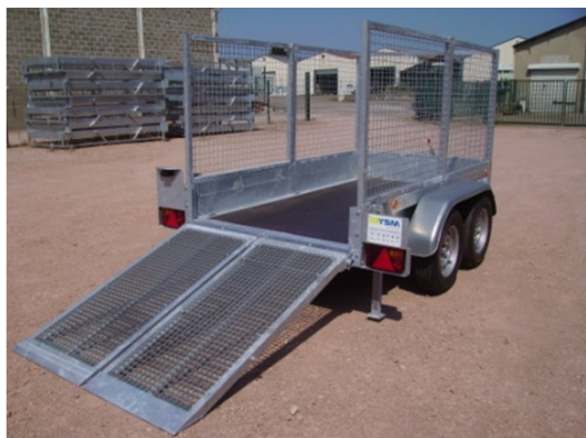
Hayon 2 volets : se déploie en 2 moitiés pour une manipulation plus aisée.

Modèle présenté : plateau fixe module DCS hayon 2 volets + option rehausse 3 faces - CU 1821 kg