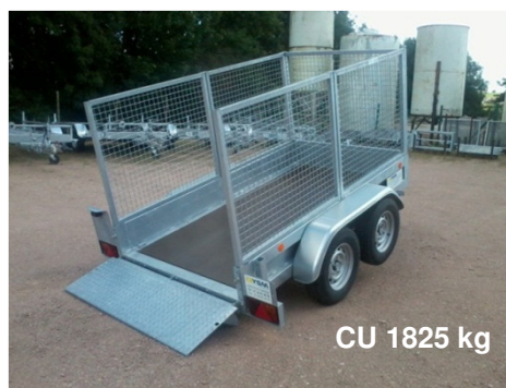
CU 1825 kg