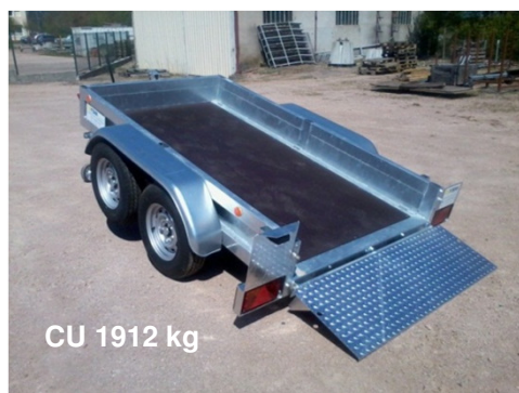
CU 1912 kg