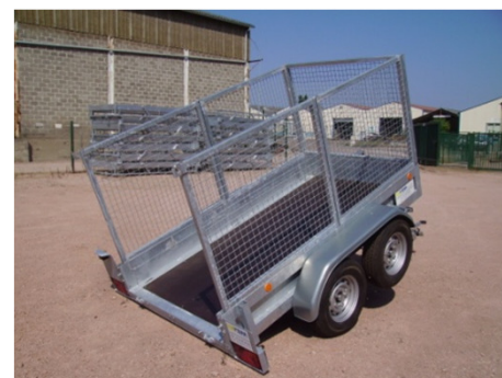
Rehausse arrière basculante et articulée par le haut