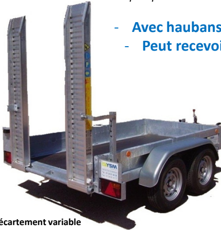
Rampes à écartement variable