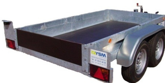
Plateau fixe et ridelle guillotine : CU 1990 kg