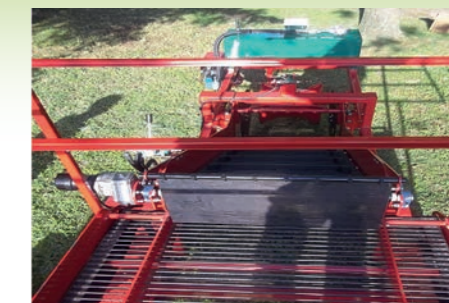
Nastro Posteriore e Cernita Rear Belt and Sorting Bande Arrière et Triage

CARLOTTI MACCHINE AGRICOLE Qualità Italiana da 50 anni