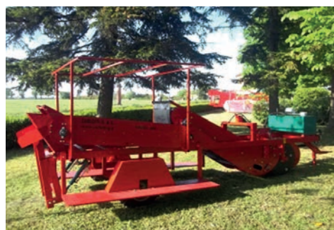
Vista laterale destra Right side view Vue du côté droit