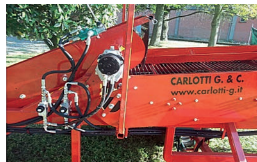
Valvole di regolazione Regulating valves Vannes de régulation