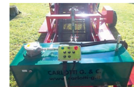
Comandi Elettro Idraulici Electro-Hydraulic Controls Commandes Électro-hydrauliques