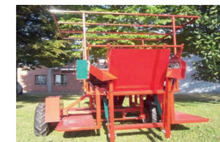
Vista posteriore delle pedane e del muletto Rear view of the platforms and forklift Vue de derrière des marchepieds et du chariot élévateur