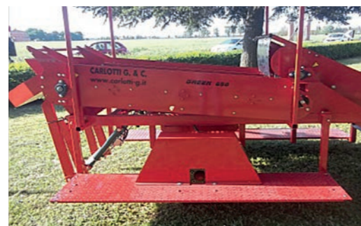
Piattaforma operativa Operating platform Plateforme opérationnelle