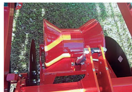
Apparato di scavo Digging unit Équipement d'excavation