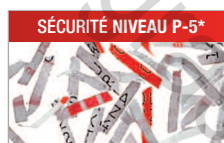
Modèle C/C - 2x15 mm Pour les documents confidentiels ou secrets.