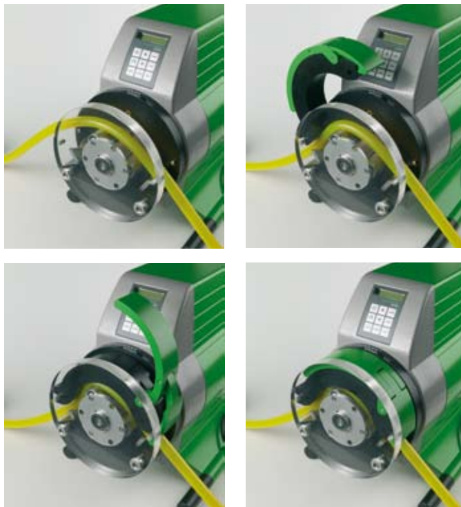
Changement du tube

La mâchoire serrant le tube a été conçue pour être manœuvrée avec une seule main et sur le principe des fixations de ski (compression facile par le dessus). Une fois la mâchoire fermée, la pompe est prête : les fermetures auto-ajustantes fixent parfaitement le tube. La forme des fermetures empêche le tube de se vriller dans la tête de pompe, prolongeant sa durée de vie. A l'inverse des constructions concurrentes complexes chargeant le tube par le devant, le tube de la SMART est monté par le dessus et son changement est ainsi facile et rapide. De ce fait, il est également possible de fixer d'autres têtes fonctionnant séparément. Par ailleurs, la plupart des pompes ont un simple système de sécurité mécanique sur le capot de la pompe, là où la SMART est équipée d'un système automatique anti-accidents.