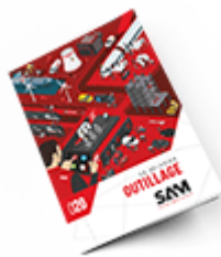
Outillage SAM 2020