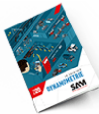
Dynamométrie SAM 2020