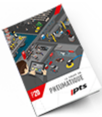
Pneumatique SAM 2020