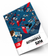
Automobile SAM 2020