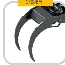
Pince pour Biomass.