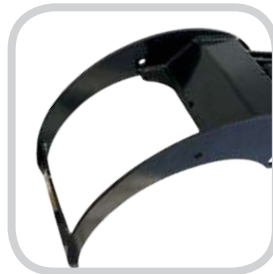
Pince en acier Nicrodur.