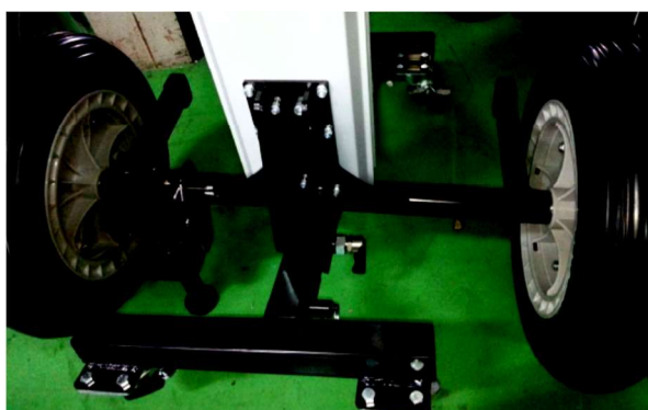
Chassis coulissant avec 4 roues et frein à pied

EN OPTION : VENTOUSES ELECTRIQUES INDEPENDANTES SUR BATTERIE RECHARGEABLE.