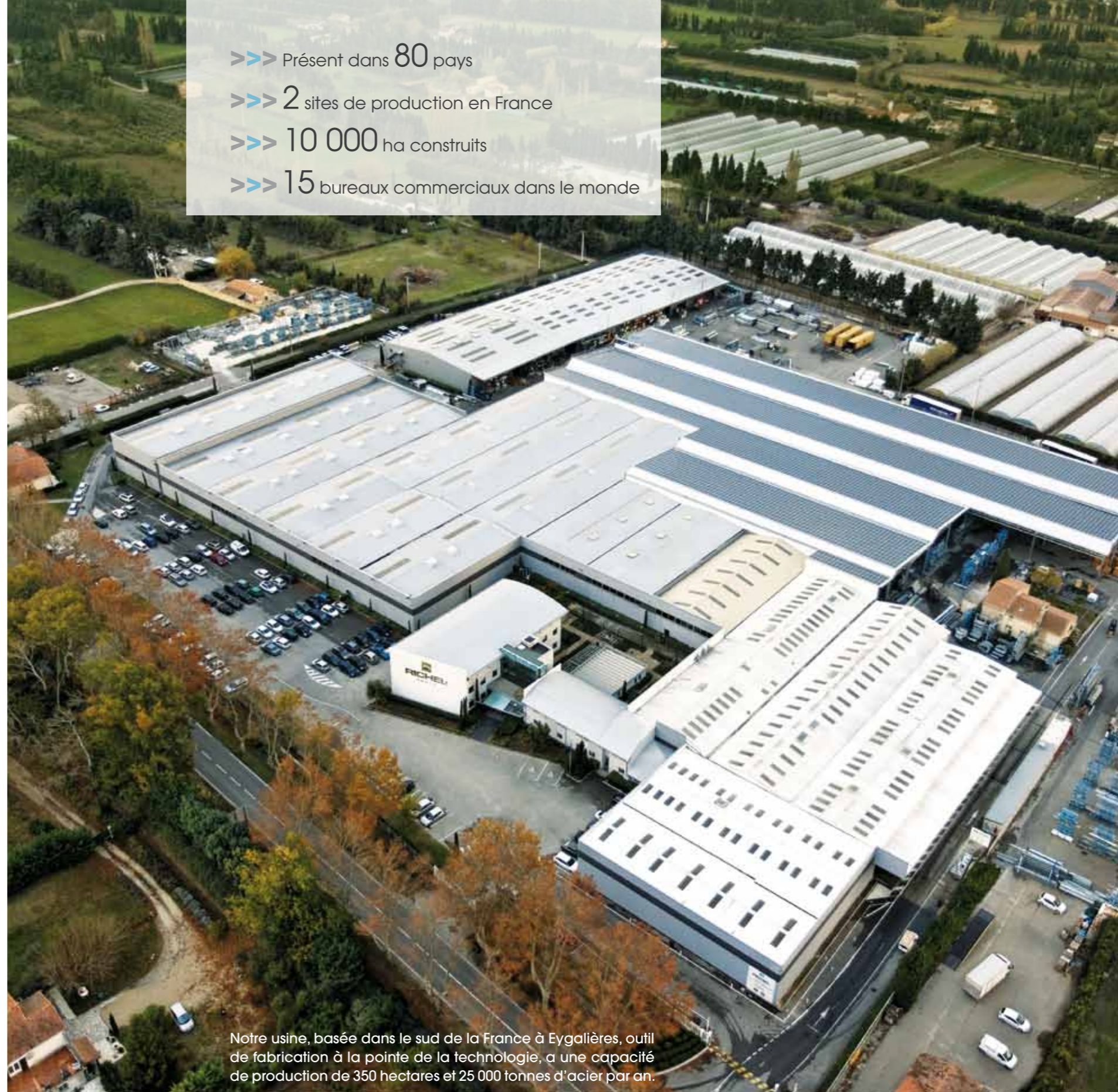
Notre usine, basée dans le sud de la France à Eygalières, outil de fabrication à la pointe de la technologie, a une capacité de production de 350 hectares et 25 000 tonnes d'acier par an.