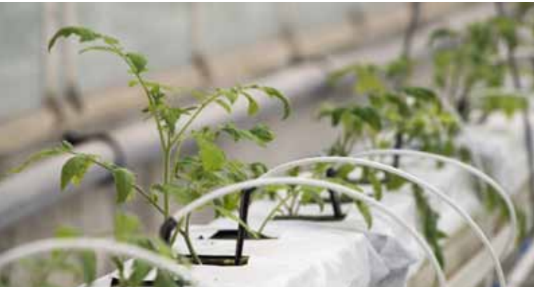
Goutte à goutte