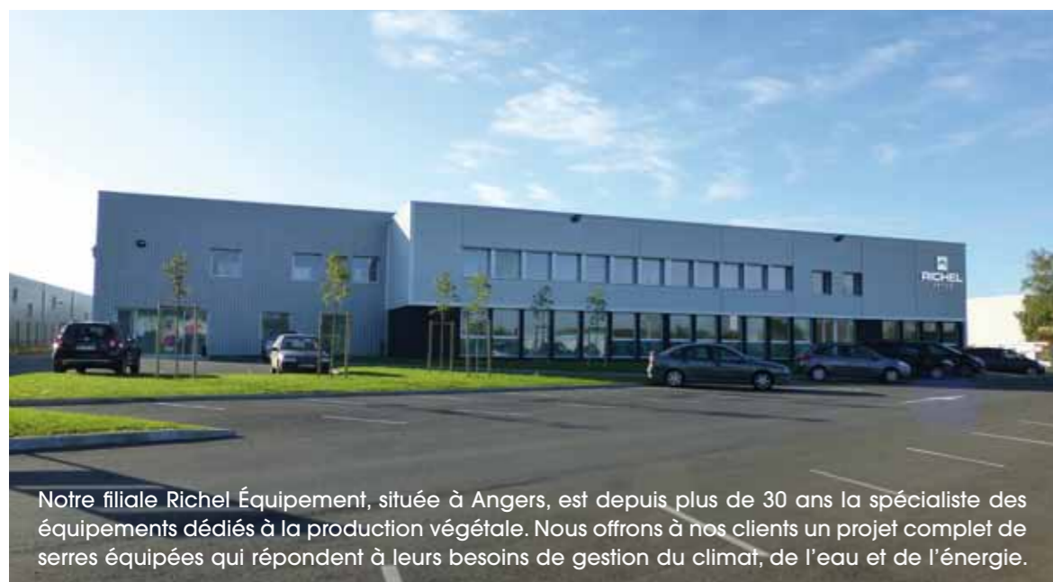
Notre filiale Richel Équipement, située à Angers, est depuis plus de 30 ans la spécialiste des équipements dédiés à la production végétale. Nous offrons à nos clients un projet complet de serres équipées qui répondent à leurs besoins de gestion du climat, de l'eau et de l'énergie.

Fournisseur de solutions agronomiques clé en main, nous nous engageons à construire une relation pérenne avec nos clients. Qualité, innovation et respect des délais pour un accompagnement durable.