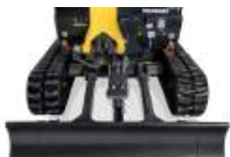
Châssis élargi : 1 170 mm