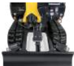
Châssis rétracté : 980 mm