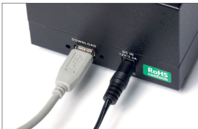
Port USB pour téléchargement ATC-110U