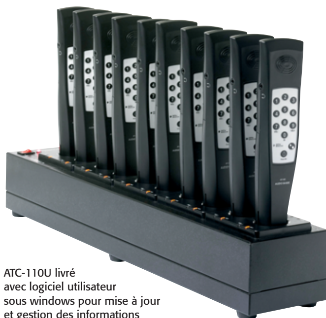
ATC-110U livré avec logiciel utilisateur sous windows pour mise à jour et gestion des informations