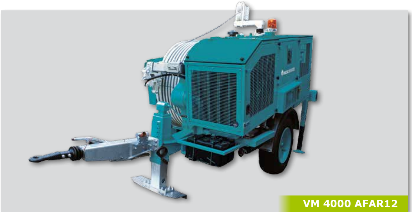
VM 4000 AFAR12