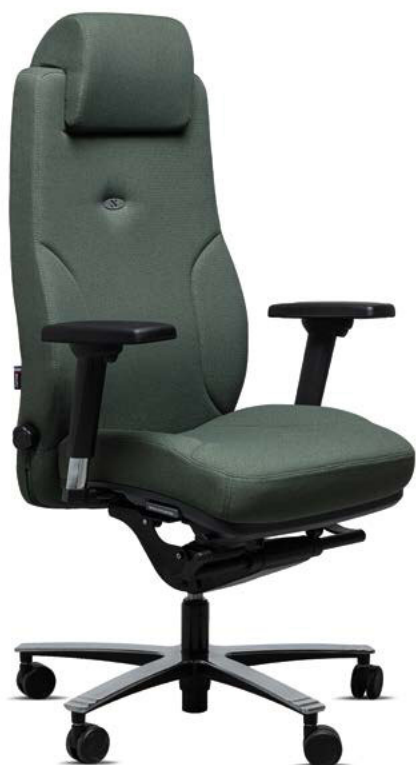
LEAD ERNEST 24h/24