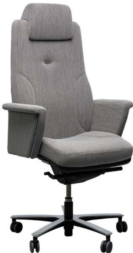
LEAD ERNEST +