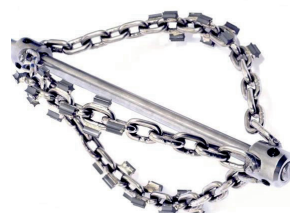
Chaînes rotatives (DN50 à 250mm)