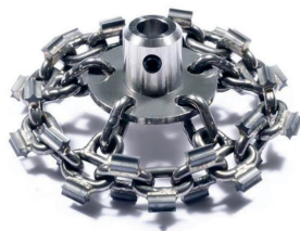
Chaînes cyclone (DN70 à 200)