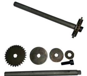
Tête de découpe (34mm, Axe 8mm dremel)