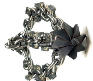
Chaînes rotatives + perceur (DN70 à 150mm)