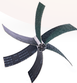
Ponçage / abrasifs (DN30 à +200mm)