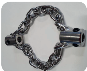
Chaînes de déblocage (DN50 à 250mm)