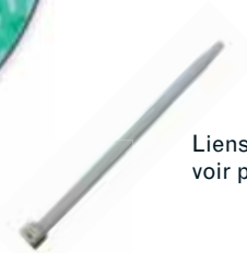
Liens plastiques voir p.27