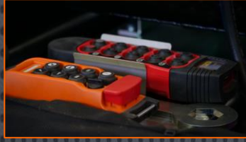
Commande à distance