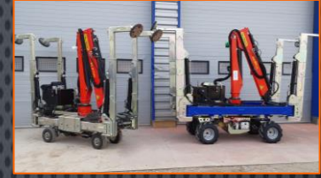
Grande variété d'options et d'accessoires