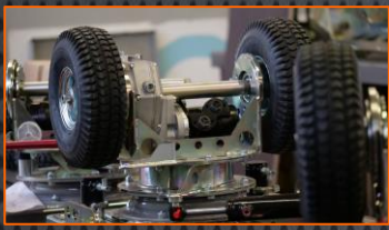
Quatre roues motrices