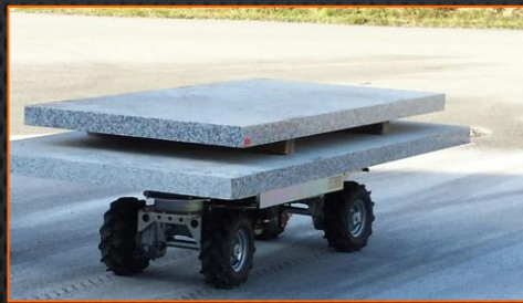
Une tonne de poussée à l'attelage en version tracteur/pousseur