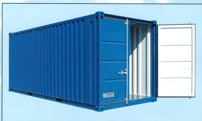
Modèle LC 20'

Nous vous livrons sur mesure selon votre besoin!