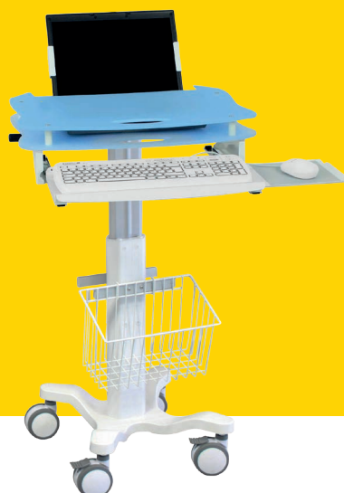
R'CARE® LIGHT POUR PC PORTABLE avec options : - rail normalisé - grand panier latéral