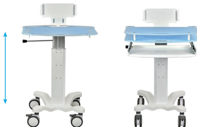
Station réf. 8E401_V02