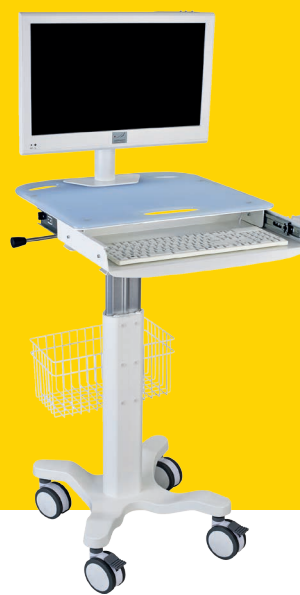
R'CARE® LIGHT VESA avec options : - support clavier / souris - rail normalisé - panier latéral