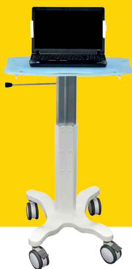
R'CARE® LIGHT POUR PC PORTABLE