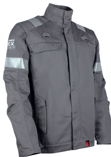
Gris Acier 20