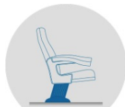
FIXATION AU SOL