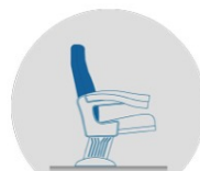
REF. 975 (DOSSIER PLUS VERTICAL)