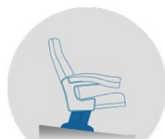
PENTE DU SOL