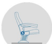
NUMÉROTATION DE RANGÉES