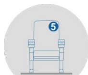
NUMÉROTATION DE SIÈGE