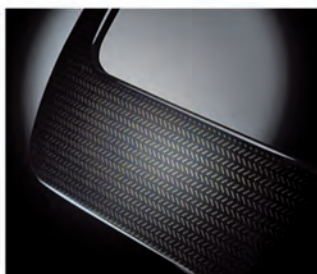
Exemples de marquage de motifs sur pièces de façades d'appareils électroménager

Notre technologie autorise une personnalisation de chaque pièce. Le temps de marquage est proportionnel à la taille du motif ainsi qu'aux matériaux des supports (nous consulter).