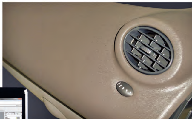
Planche de bord en Polypropylène (longueur 1300 mm, longueur du motif 1200 mm, profondeur du motif 78 mm).