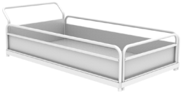
Plateforme 695x1250xh230 mm A030.700