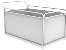
Plateforme 800x1250xh630 mm A031.715