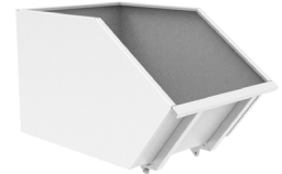
Cuve 500 L A016.800