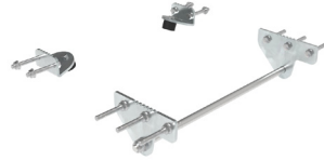
Kit de connexion complet A403.701