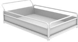
Plateforme 885x1250xh230 mm A031.700