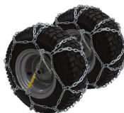
Kit pneus et chaines à neige R213.700