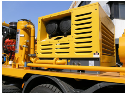
Compressore d'aria Air compressor Compresseur d'aire Kompressor Compresor Компрессор