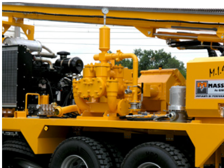
Pompa fango Mud pump Pompe à boue Spülpumpe Bomba de lodo Грязевой насос