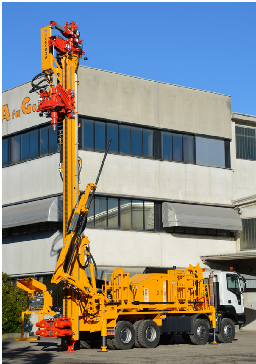
Caricatore aste con braccio Pipe loader with arm Chargeur de tiges avec bras Bohrgestänge-lader mit arm Cargador de barras con brazo Манипулятор подачи штанг