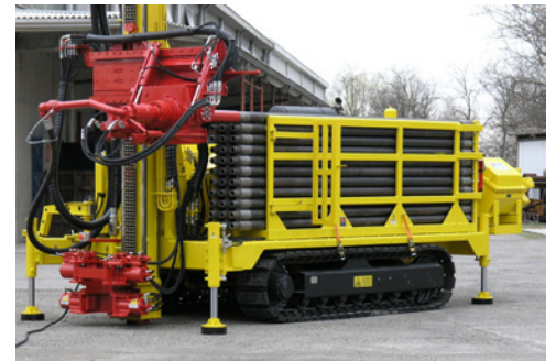
Caricatore aste Pipe loader Chargeur de tiges Bohrgestänge-lader Cargador de barras Автопогрузчик штанг