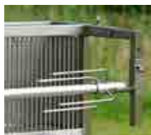
Broche et lardoires inox