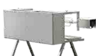
Démontage et rangement facilités