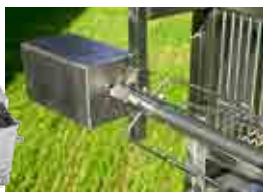
Construction robuste tout inox