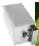
Moteur électrique 220V | 34 W | 3,2 T/min