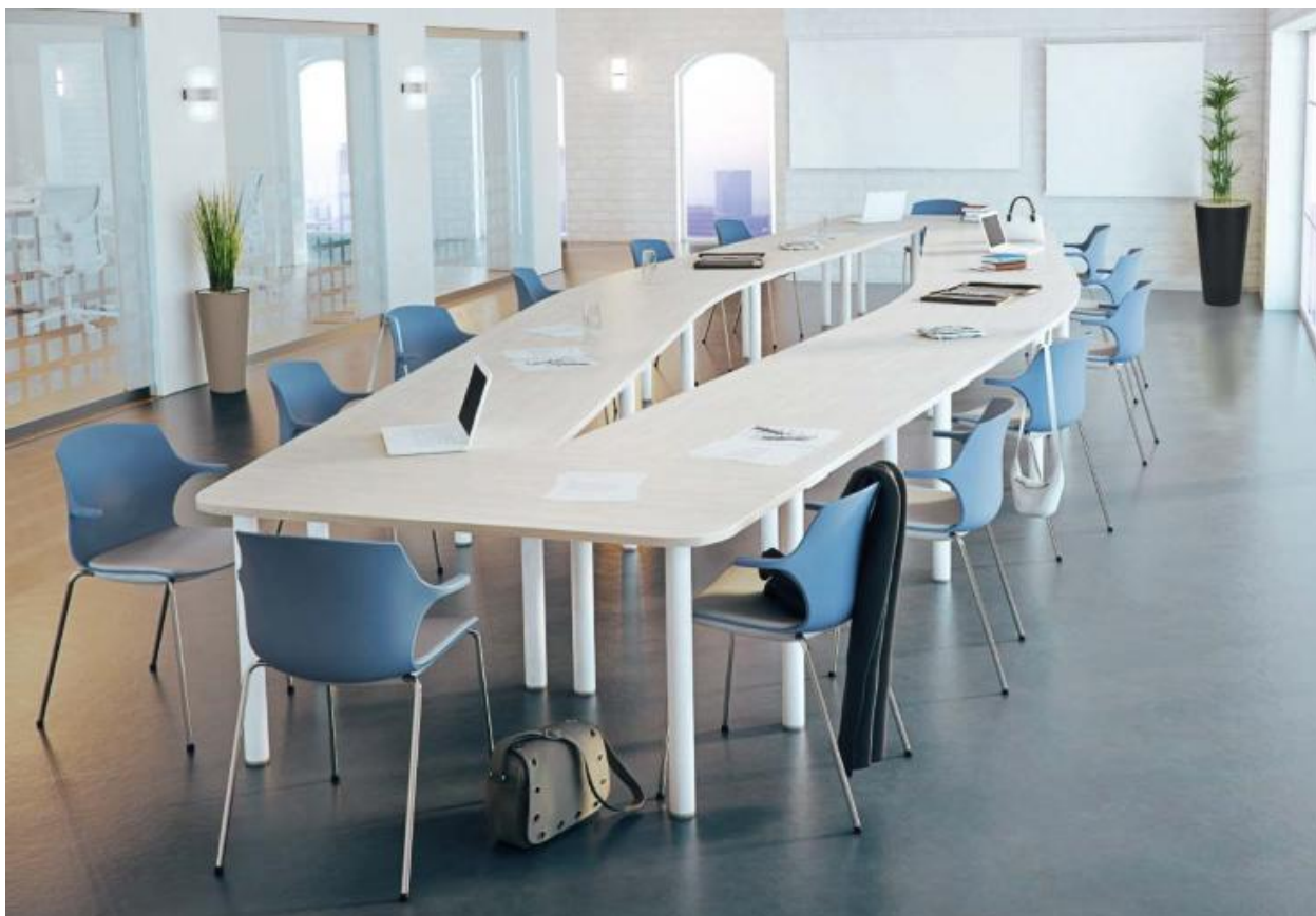
Table modulaire EASY

EASY est une table qui a pour principe de partager les pieds : composez votre table idéale et minimisez le nombre de pieds.