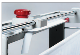
Tête de coupe ergonomique avec lame rotative coulissante