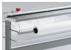
Équipée d'un porte-rouleau de papier (en option)