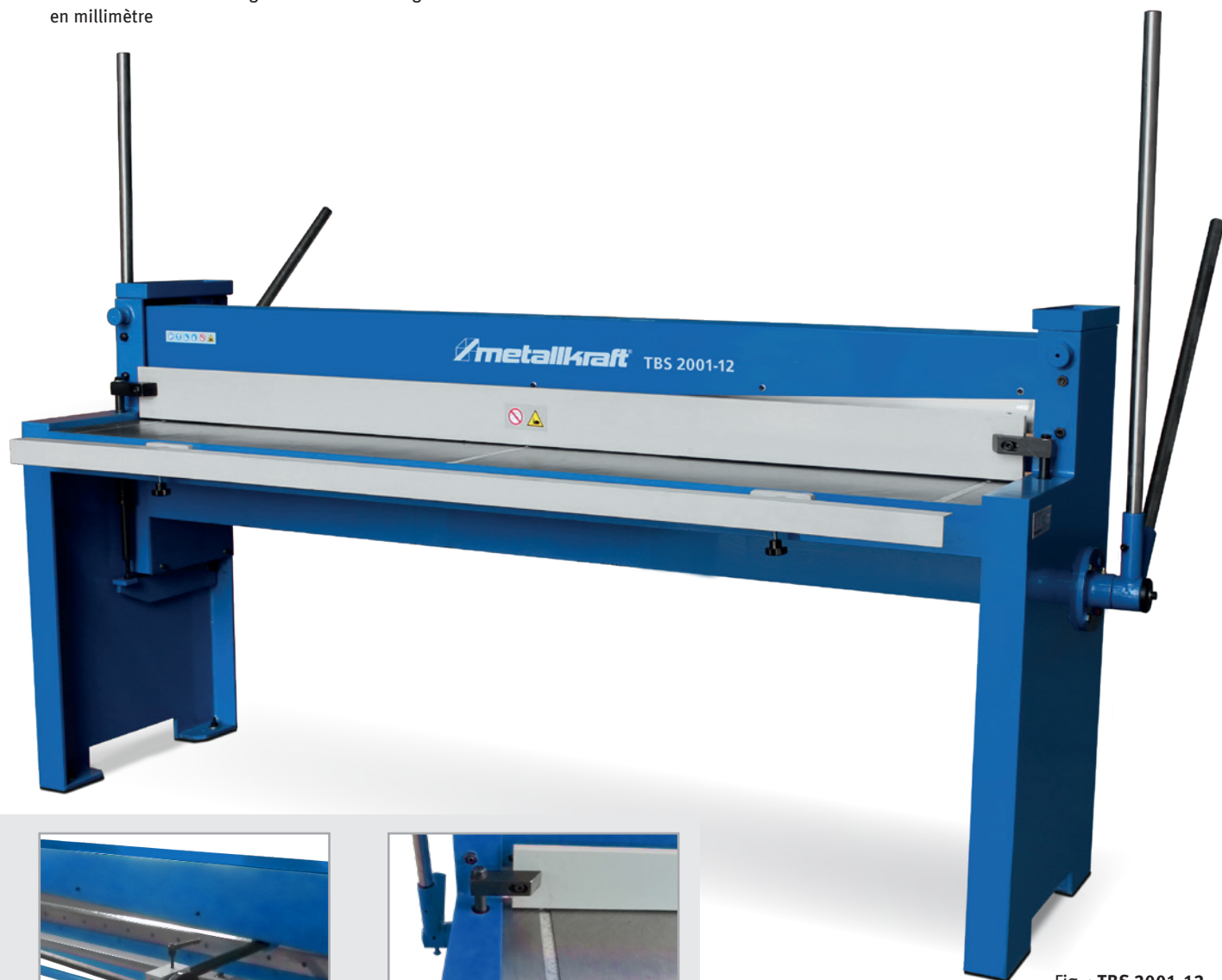
Fig. : TBS 2001-12