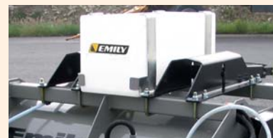
Réserve d'eau 100 L