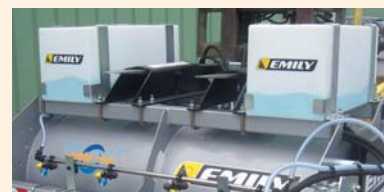
Réserve d'eau 2x100 L