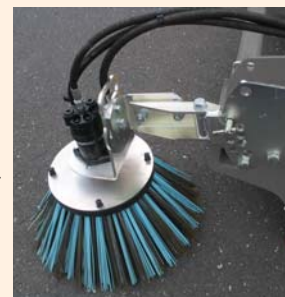
Brosse latérale mixte