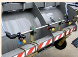
Rampe d'arrosage par pression