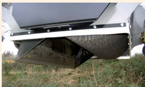
Bac de ramassage basculant et balai polypropylène dense