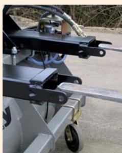
Kit d'accrochage sur fourreaux flottants avec fixations sécurisées