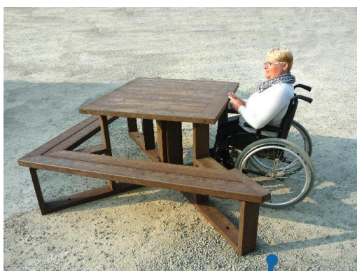
Version PMR 1 fauteuil