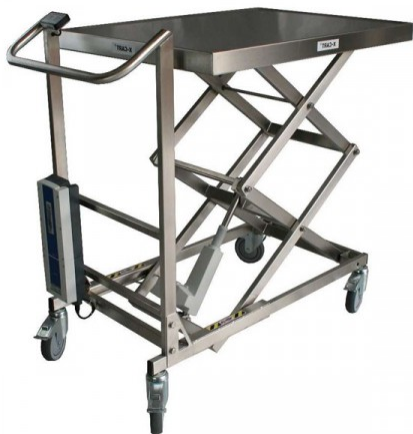
Table élévatrice électrique en inox charge 100 kg

Table de levage inox - Charge 100 kg - Haut. de levée 300 à 1000 mm