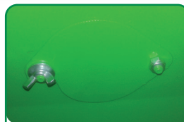
2 salidas de vaciado 2 sorties de vidange 2 emptying exits