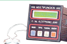
Opción para / Option pour / Option for