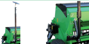
Opción para / Option pour / Option for