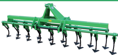
Opción para / Option pour / Option for