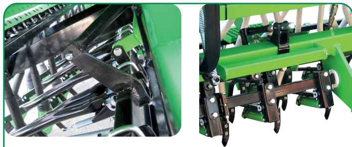
Control de profundidad / Contrôle de profondeur / Depth control