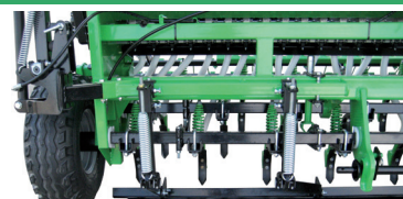
Opción para / Option pour / Option for