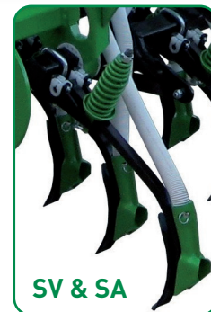
SV & SA