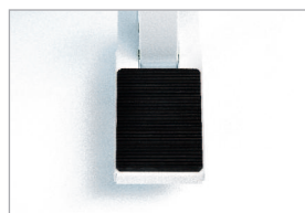
Dispositif de pression dosable par pédale