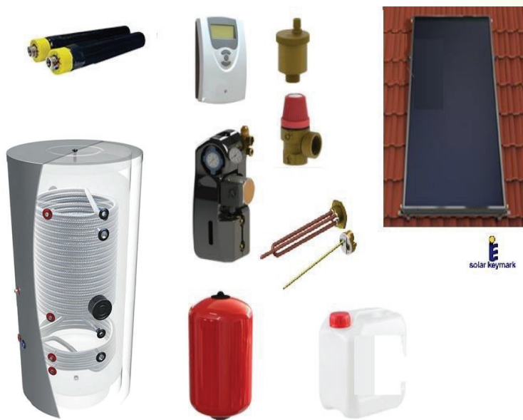
Schéma entrée/sortie du ballon BST