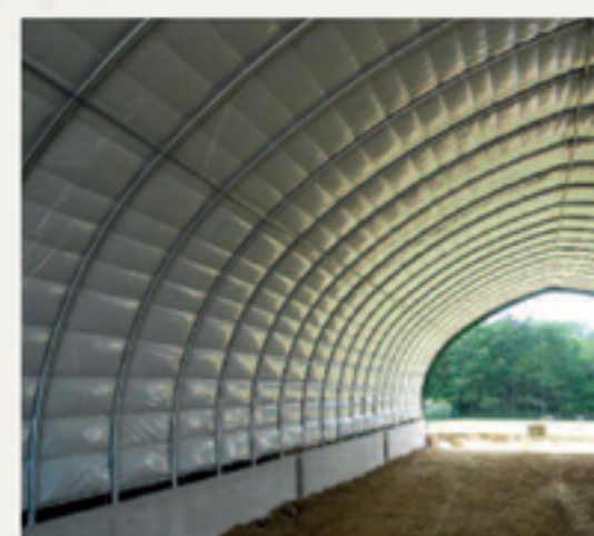
Tunnel Basilique implanté sur muret avec laine de verre.