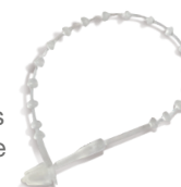
3 Lot de 10 pc scellés ("plombs") plastique PS903KG