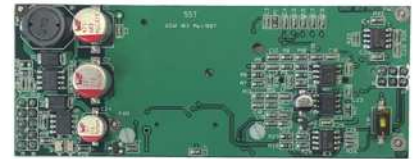
DIP-GSM DIP-GSM/3G DIP-GSM/4G