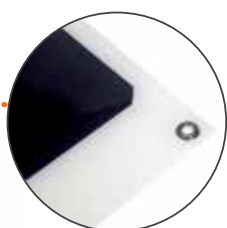
■ OPTION : OEILLET