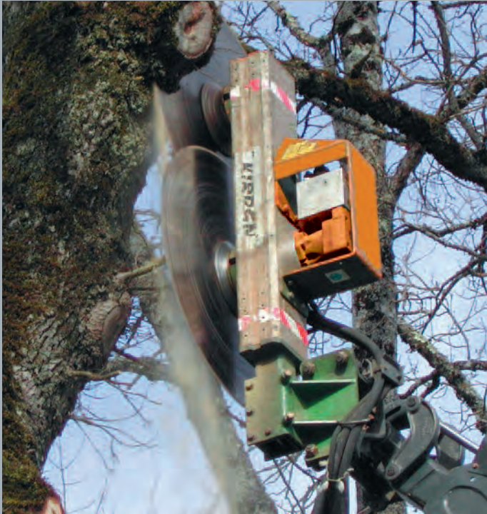
LEM 9002 (largeur de coupe 1m54)