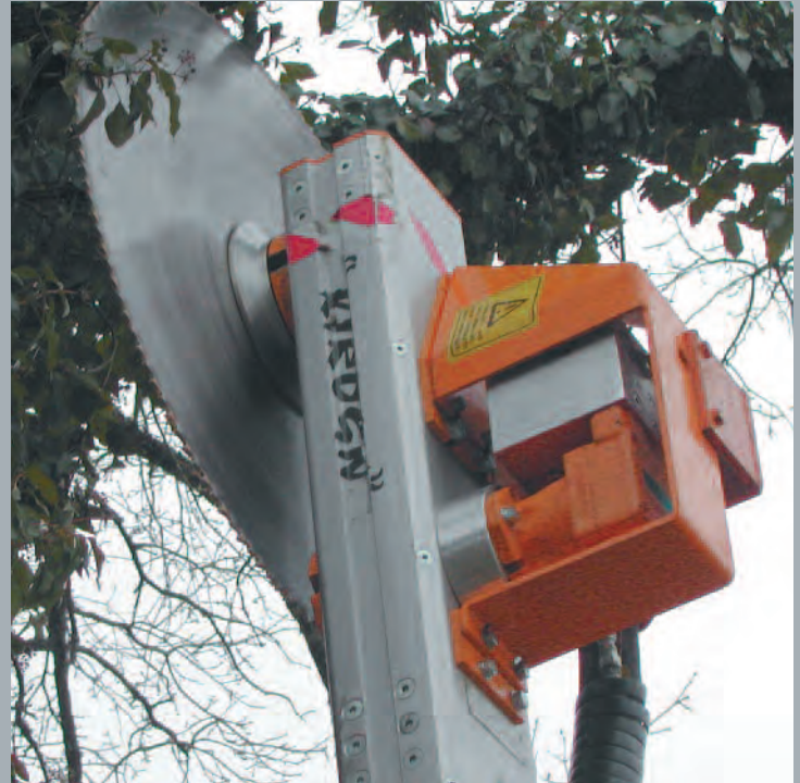
LEM 9001 (largeur de coupe 0m90)