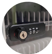
Double système de fermeture à code et à clé