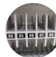
Emplacements numérotés pour une gestion simplifiée