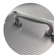
Poignée de transport