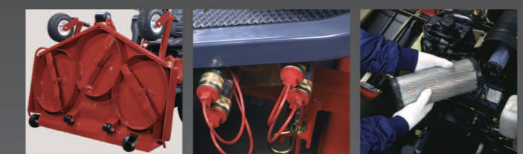
Tondeuse réglable verticalement