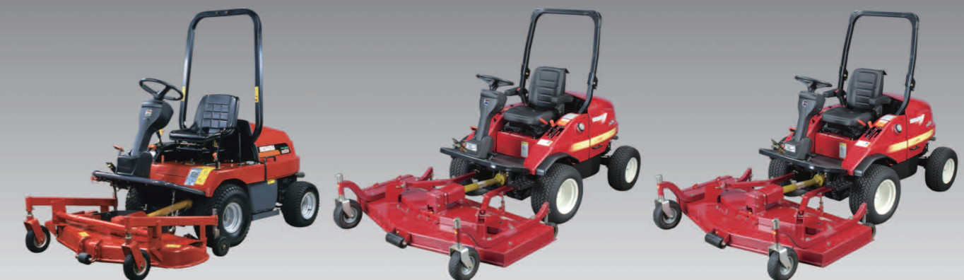
CM214 24 CV/ (17,6 kW)

Le moteur diesel Shibaura est connu pour sa facilité de maintenance. D'un côté du moteur, vous pouvez vérifier le niveau d'huile, remplacer le filtre à huile et effectuer d'autres contrôles nécessaires importants.