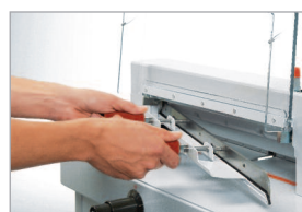
Dispositif de changement de lame protégeant le tranchant

Massicot électrique à pression manuelle adapté au format A3. Idéal pour le service reprographie des entreprises et administrations.