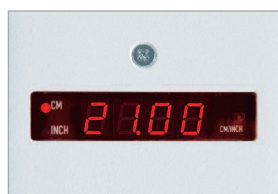
Affichage digital des dimensions en mm / pouces