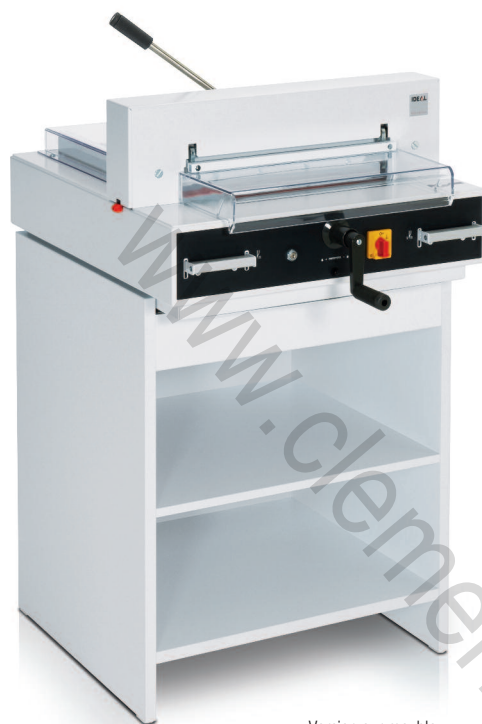
Version sur meuble