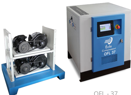
OFL - 37