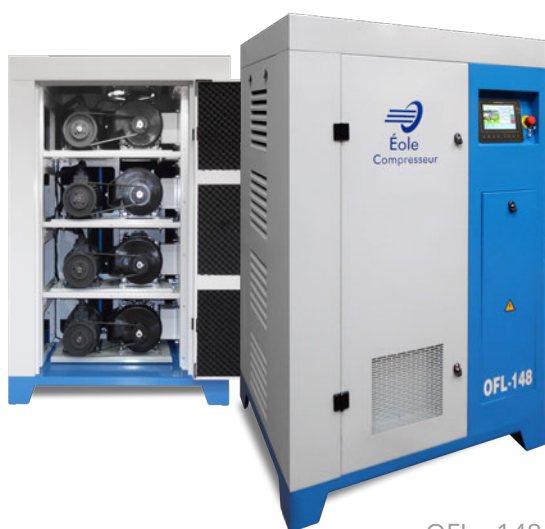
OFL - 148