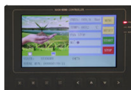
Contrôleur Éole 6090