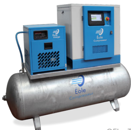
OFL - T

Notre gamme de centrale RUBIS fournit un air 100 % déshuilé dédié à l'industrie agroalimentaire et Filière laitière.