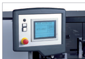
Panneau de commande tactile pour tous les réglages