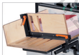
Taqueuse de réception haute pile avec butée réglable