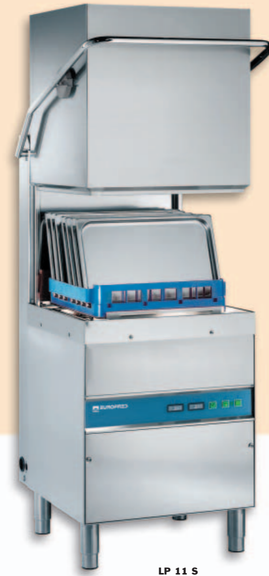
LP 11 S