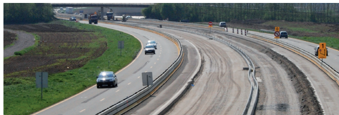
Fourniture de grave naturelle du Rhin de type D3.