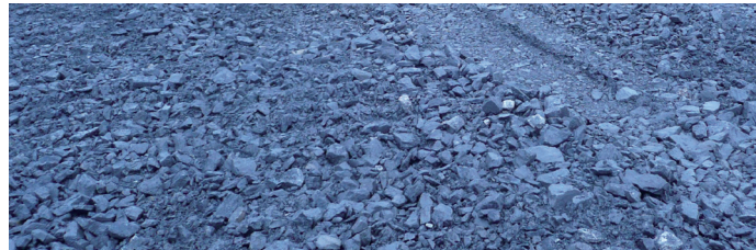
Livraison de granulats calcaires.