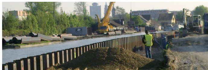
Fourniture de grave naturelle du Rhin de type D31.